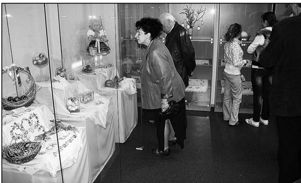
• Экспозиція выставкы Традиції Русинів на Словеньску почас великодных свят.

22. марца 2011 у сполупраці з Клубом Русинів Словеньска СНМ – Музей русиньской культуры у своїй засідальні на ул. Масаріковій 10 у Пряшові приправив бісіду з лідром Русинів Северной Америки – Джоном Рігеттіом, президентом Общества карпатських Русинів із центром в Піттсбургу, на тему Жывот і активности Русинів у США.