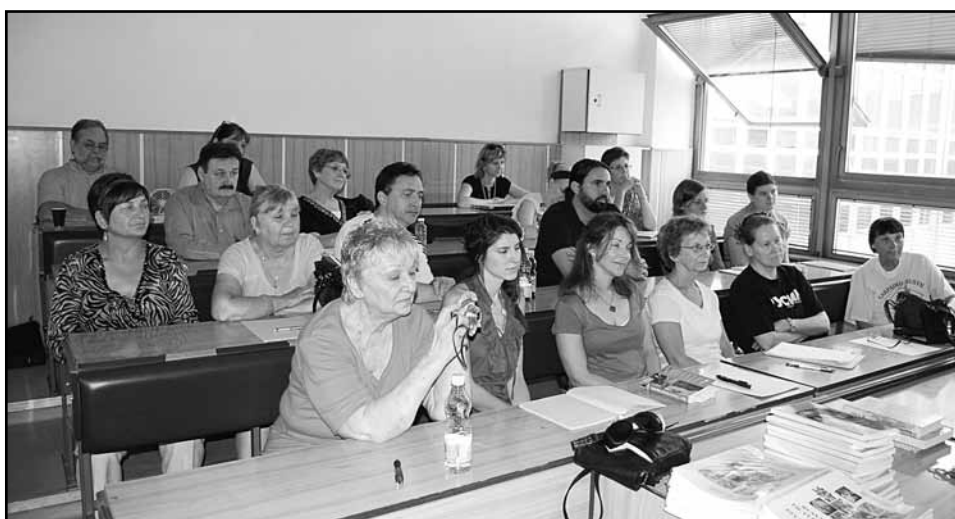
• Участници 1. річника літнєй школы русиньского языка і культуры, міджі котрыма найвеце є штудентів із США. Тому важну подію зорґанізували: Інштїтут русиньского языка і культуры ПУ в сполупраці зо Словеньсков асоціацію русиньских оргнізацій і Карпаторусиньским научным центром в США.