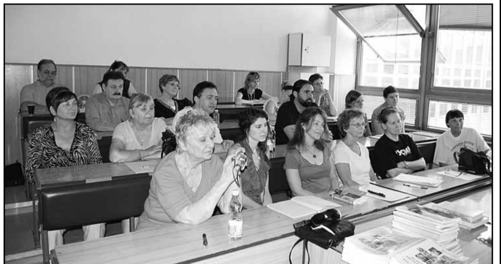
• Участници 1. річника літнєй школы русиньского языка і культуры, міджі котрыма найвеце є штудентів із США. Тому важну подію зорґанізували: Інштитут русиньского языка і культуры ПУ в сполупраці зо Словеньсков асоціацію русиньских орґанізацій і Карпаторусиньским научным центром в США.