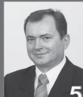
Michal Lukša 44-ročný poslanec NR