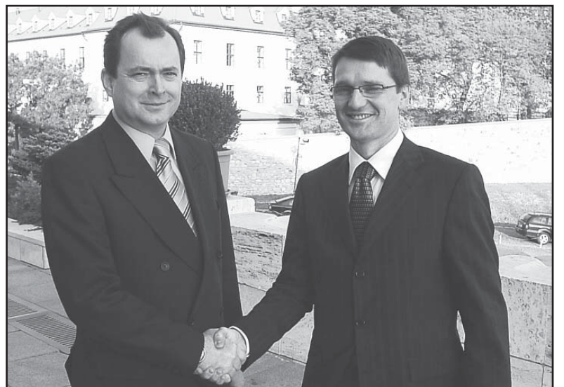
• Посланець НР СР зо своїм партїіным колегом, міністром культуры СР Марекон Мадярїчом.