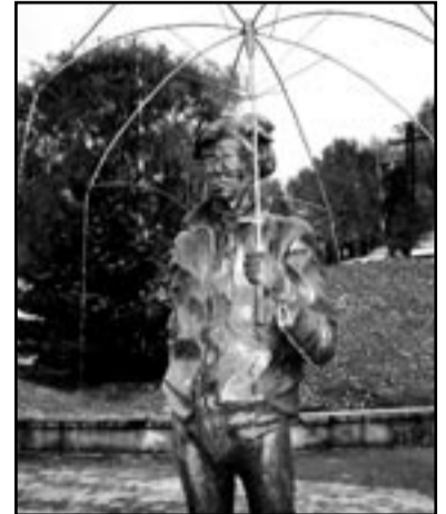
• Портрет Енді Варгола од Даниела Бродянія, погляд на нову фасаду Музею модерного уменя Енді Варгола в Міджілабірцях і соха-фонтана перед музеєм од Юрая Бартуса подля ідейно-вытварной пропозиції Михала Бицка.